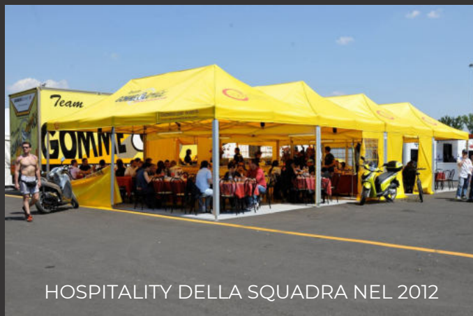
HOSPITALITY DELLA SQUADRA NEL 2012

80 metri quadri con cucina e 100 posti a sedere per fornire i pasti a tutto il team durante i weekend di gara: piloti, meccanici, parenti, amici ma anche aziende, partners e clienti